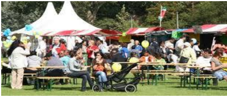
Milan, festival in Nederland